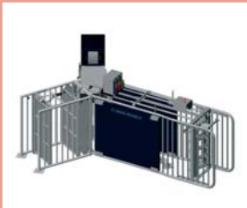
KRMNÁ STANICE NEDAP

Nedap Velos separační jednotka se stará o automa- tické oddělení břez- ních prasnic ze skupiny.