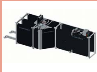
CENTRÁLNÍ SEPARAČNÍ JEDNOTKA

Elektronická krmná stanice Velos zajišťuje, aby každá prasnice dostala ve správný čas v odpovídající kvalitě správné množství zrádla.